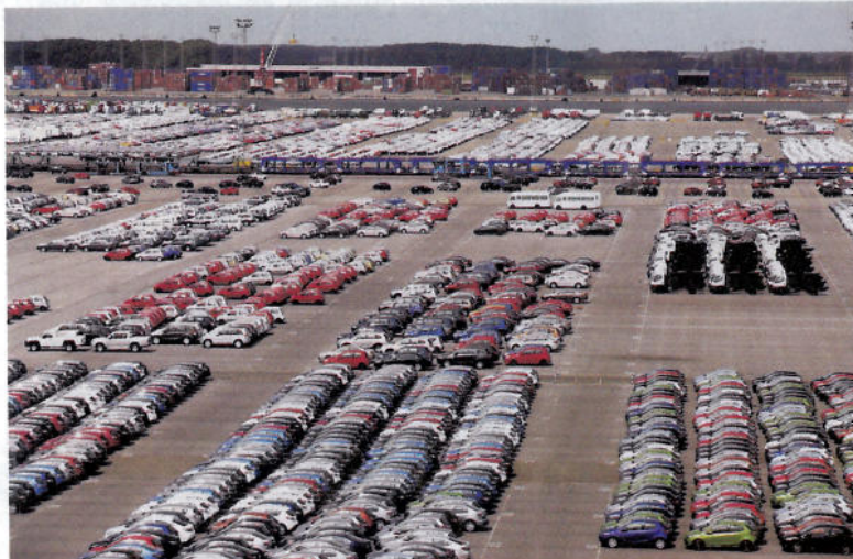
Na ploše 120 ha parkuje až 60 000 vozidel asijských značek, plocha pro mazdy činí 43 ha (18 000 aut)

Proces vylodění sledujeme na vlastní kůži, nejlépe ho vykresluje samotný úvod reportáže. Překvapuje nás hlavně rychlost jdoucí ruku v ruce s precizností. Trasa Japonsko-Belgie trvá po oceánu pět týdnů, plus minus dva dny připadají na rozmary počasí. Přijíždíme právě včas, šoféři pendlují mezi nákladovým prostorem a parkovištěm. Břicho plavidla pojme 4500 automobilů, ve dvou směnách trvá vyložení aut 16 hodin. Není prostor na otálení, rčení o čase a penězích zde platí víc než jinde. Zvědaví nahlížíme dovnitř, kde nás upoutávají bok po boku naskládané mazdy. Rozestupy mezi nimi nečiní víc než deset centimetrů. Ale co to? Ve VIP prostoru spatřujeme opravdové skvosty - přes desítku nádherných veteránů Mazda Cosmo Sport - prvních mazd s Wankelovým motorem, mířících na novinařskou akci v Evropě. Tady už neběží vykládka tak promptně, s klenoty se musí zacházet jako s porcelánem. Někteří kouskům se nechce startovat,