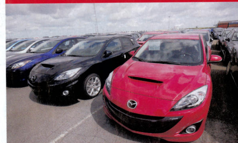
Našemu MPS dělalo na parkovišti společnost černé provedení mířící do Švýcarska