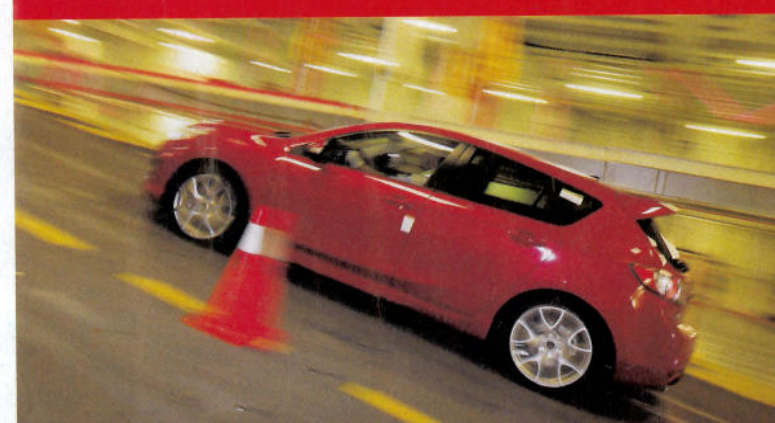
Červená Mazda 3 MPS se dere na vzduch, cestu vyznačují provizorní kužele