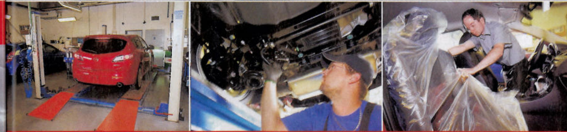
Po složení z přívěsu jde MPS na dílnu, kde ho naposledy zkontrolují. Součástí prohlídky je i odstranění ochranných prvků karosérie a interiéru. Řidič traileru si skládá vozy sám, zodpovídá také za jejich stav. Dobré pojištění není od věci.