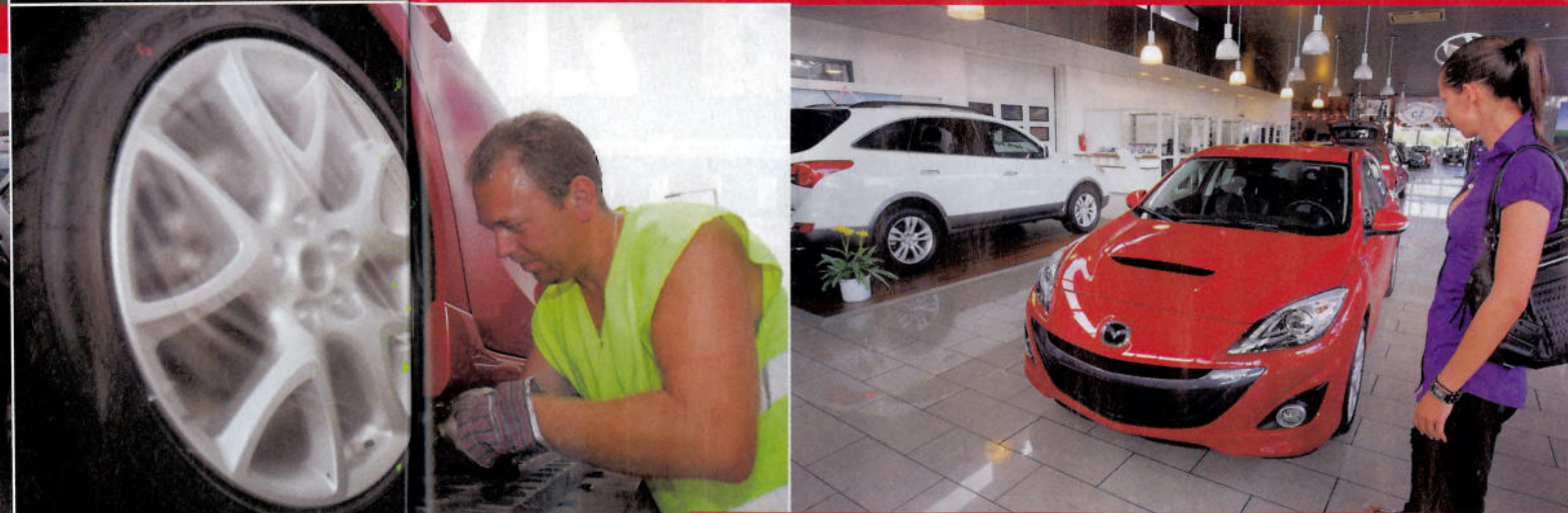
Pouť je ve finále - Mazda 3 MPS čeká na kupce v showroomu. Dlouho se tam asi neohřeje...